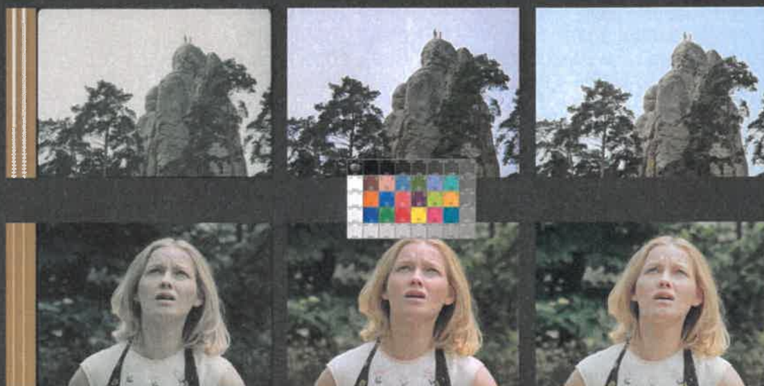
JAK DOSTAT TATÍNKA DO POLEPŠOVNY (1978) – režie Marie Poledňáková, kamera Petr Polák

DRA Z ORIGINÁLNÍHO NEGATIVU EASTMAN COLOR 5247