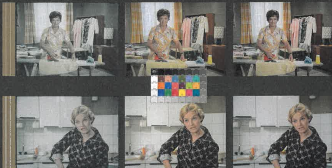
JAK DOSTAT TATÍNKA DO POLEPŠOVNY (1978) – režie Marie Poledňáková, kamera Petr Polák

DRA Z ORIGINÁLNÍHO NEGATIVU EASTMAN COLOR 5247