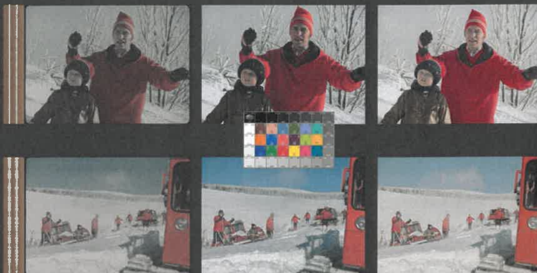
JAK VYTRHNOUT VELRYBĚ STOLIČKU (1977) – režie Marie Poledňáková, kamera Petr Polák

DRA Z ORIGINALNÍHO NEGATIVU EASTMAN COLOR 5247