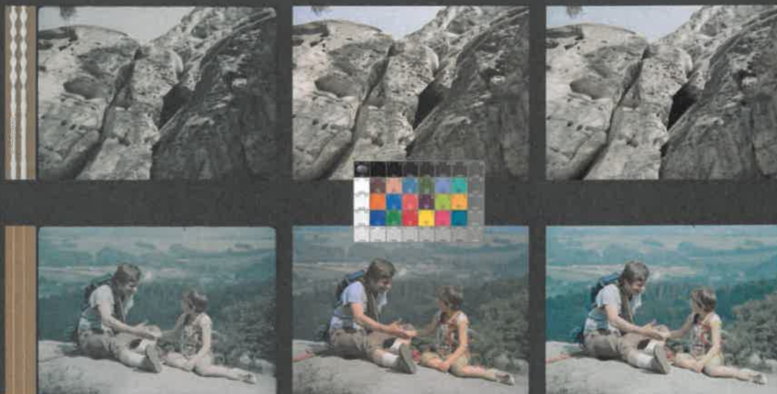
JAK DOSTAT TATÍNKA DO POLEPŠOVNY (1978) – režie Marie Poledňáková, kamera Petr Polák

DRA Z ORIGINALNÍHO NEGATIVU EASTMAN COLOR 5247