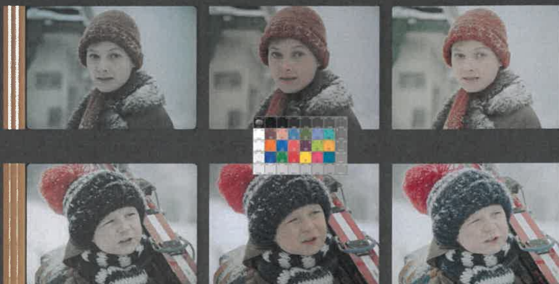
JAK VYTRHNOUT VELRYBĚ STOLIČKU (1977) – režie Marie Poledňáková, kamera Petr Polák

DRA Z ORIGINALNÍHO NEGATIVU EASTMAN COLOR 5247