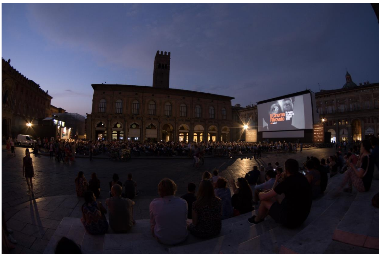
Večerní zahájení festivalu IL CINEMA RITROVATO na náměstí Piazza Maggiore v italské Bologni

Italské město Bologna, ve kterém vznikla první evropská univerzita, se stala místem prvního spatření tohoto unikátního záběru. Nikdo jej nikdy před tím neviděl a zřejmě v plné délce ani sám Marey. Dne 28.6. 2017 proběhne v rámci festivalu druhá projekce filmu doplněná o odbornou prezentaci projektu NAKI za účasti odborníků z AMU, Národního technického muzea v Praze a Národního památkového ústavu v Praze.