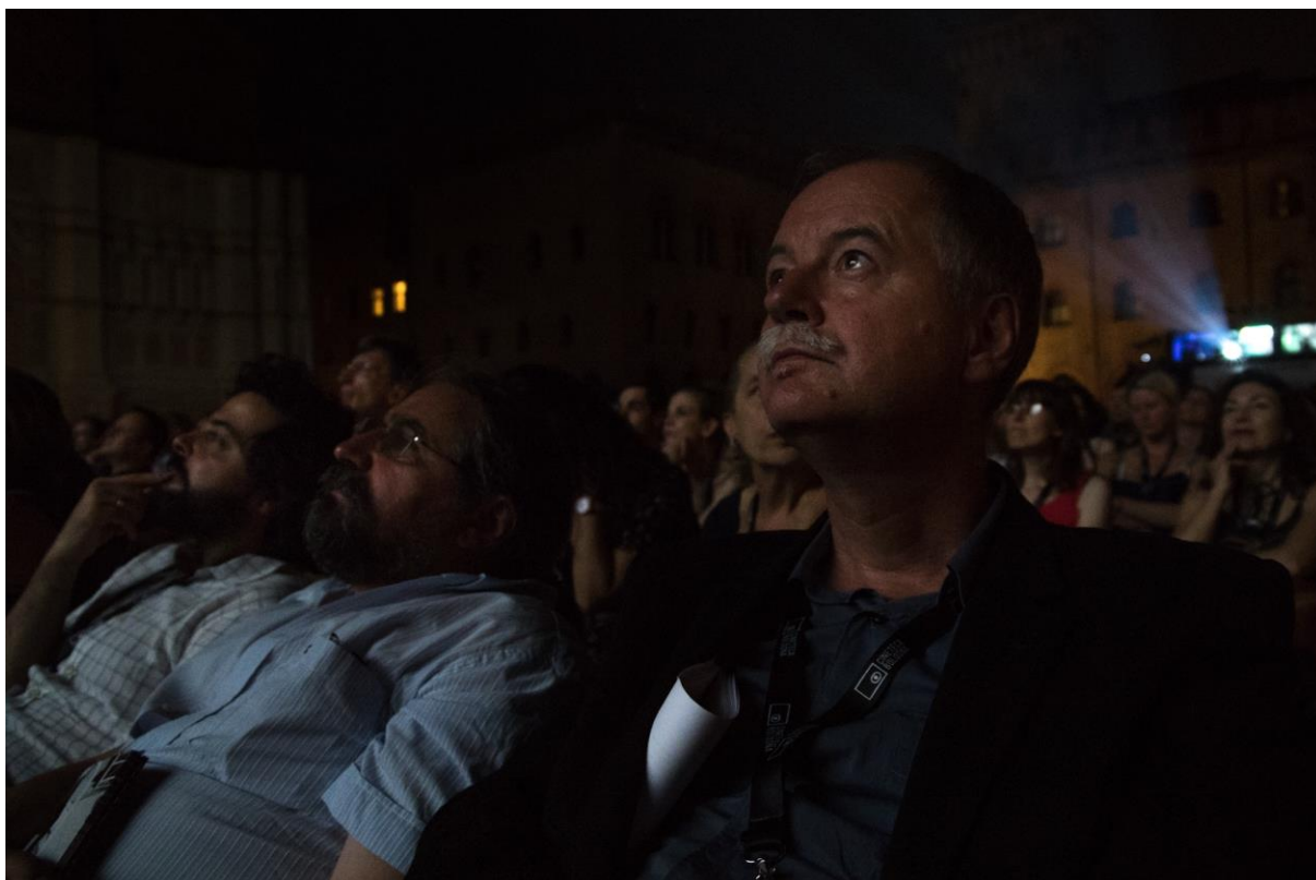
Diváci měli možnost shlédnout tento 45 vteřin dlouhý záběr celkem 4x a to i ve formě negativního obrazu