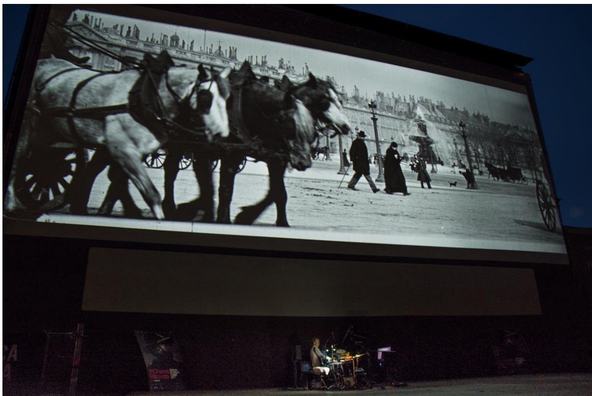
Zahajovací projekce 31. ročníku festivalu Il Cinema Ritrovato, Mareyův film doprovázený klavíristou