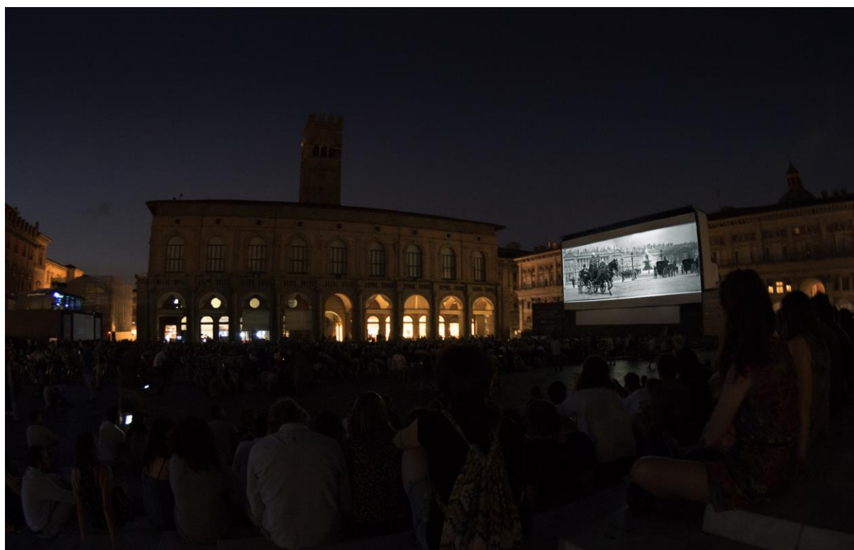
Bologna - Piazza Maggiore a světová premiéra jednoho z prvních kinematografických záznamů Paříže pořízeného Étienne-Julesem Mareyem před 120 lety.